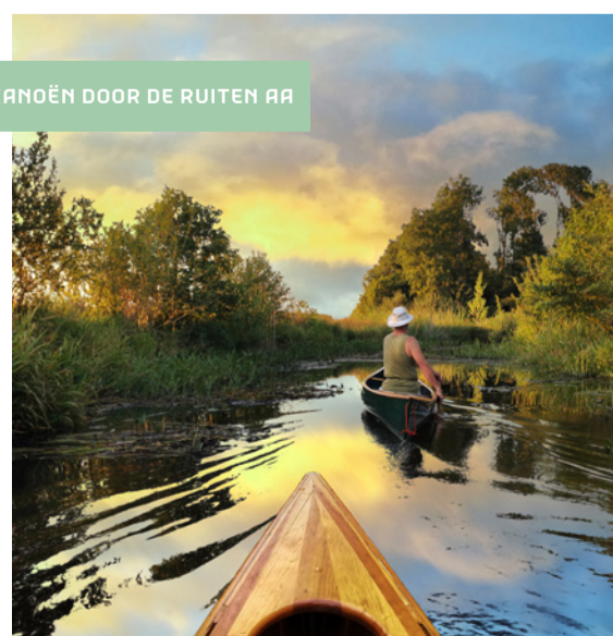
KANOËN DOOR DE RUITEN AA

Een goede manier om Westerwolde te ontdekken is vanaf het water. Met je kano of kajak vaar je moeiteloos door het schitterende landschap. Via verschillende rivieren, kanalen en beken kom je langs knusse dorpjes en aantrekkelijke bezienswaardigheden. Zo kun je met je eigen boot naar Bourtange varen of een bezoekje brengen aan onze oosterburen tijdens een rondgaande toertocht. Voor vissers is Westerwolde het ultieme stekje. Dankzij vistrappen kunnen de vissen van de Aa's naar de zee zwemmen en weer terug. Goed voor de vissen én voor de visser!