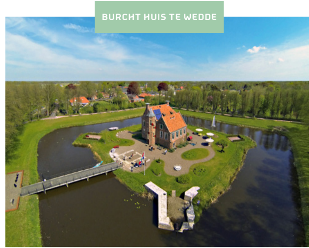
BURCHT HUIS TE WEDDE

Mooie beekdalen, verrassende uitzichten, historische gebouwen en middeleeuwse bossen: het Nationaal Cultuurhistorisch landschap van Westerwolde nodigt uit om te wandelen. Je kunt een keuze maken uit 40 wandelroutes, die variëren in lengte van 1,5 tot 16 kilometer. Ook zijn er wandelroutes speciaal voor kinderen, waarbij ze leuke opdrachten krijgen. In het 4e weekend van juni vindt het jaarlijkse Westerwolde Wandelweekend plaats, waarbij je een of twee dagen kunt komen wandelen.