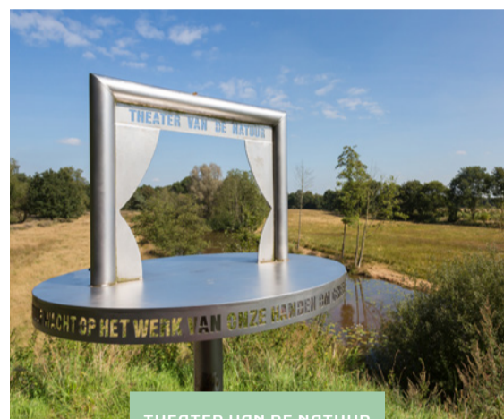
THEATER VAN DE NATUUR