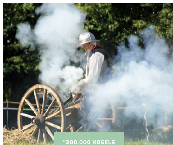
200.000 KOGELS KAN HIJ KRIDGEN!

De poorten van Vesting Bourtange zijn dagelijks geopend. De vorm is bijzonder: vijf bastions zijn geheel omringd door water met hoge vestingwallen. Hierdoor kon men de vijand al vanaf verre zien aankomen en het maakte ze moeilijk om binnen te komen. Via een van de drie imposante bruggen loop je naar binnen waar je meer te weten komt over de geschiedenis in de vijf aanwezige musea. Er zijn leuke winkeltjes en terrassen en als je geluk hebt, wordt er geschoten met de oude kanonnen.