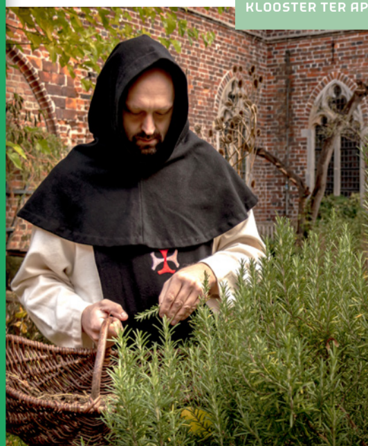
KLOOSTER TER APEL

In de bosrijke omgeving van Ter Apel ligt een unieke cultuurhistorische parel: het voormalig kruissherenklooster Domus Novae Lucis uit 1465. Dit nog enige bestaande middeleeuwse plattelandsklooster in Nederland staat op de Werelderfgoedlijst van UNESCO. Het is nu een museum met boeiende tentoonstellingen. In de kloostertuin staan meer dan 200 verschillende plantensoorten en in de kloosterwinkel vind je bijzondere producten. Vergeet vooral de bierkelder niet te bezoeken!