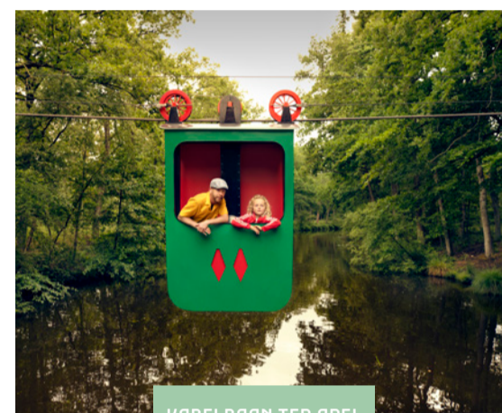
KABELBAAN TER APEL

Dwars door Westerwolde kronkelt De Ruiten Aa, ook wel de 'ruggengraat van Westerwolde' genoemd. De Ruiten Aa is in de jaren zestig rechtgetrokken en in de jaren negentig hersteld. Langzaam kreeg ze haar oorspronkelijke bedding terug. Het resultaat van de herstelwerkzaamheden is een bijzonder gebied met prachtige natuur. Dat het in zo'n korte tijd zoveel verschillende habitats vertoont, is uniek in Nederland. Het dal staat bekend als een van de mooiste beekdalen van Nederland.