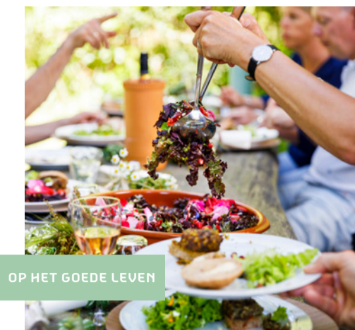
OP HET GOEDE LEVEN

Westerwolde is een van de elf Cittaslow-gemeenten die Nederland rijk is. Cittaslow is het internationale keurmerk voor gemeenten die zich inzetten voor verbetering van de kwaliteit van leven door het authentieke te koesteren en daarmee de sprong naar de toekomst maken. Traditie gaat hand in hand met innovatie. Het betekent een erkenning van het finschalige gebied waar het goed wonen, werken en leven is. Kernelementen zijn: identiteit, kwaliteit, traditie, voedsel en duurzaamheid.