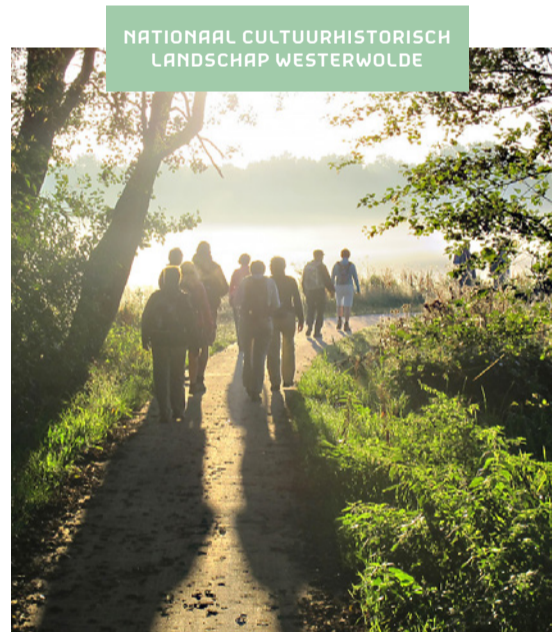
NATIONAAL CULTUURHISTORISCH LANDSCHAP WESTERWOLDE

Aan de Hoofdweg, bij de ingang van het dorp Wedde, ligt de Burcht Huis te Wedde. Deze burcht heeft een rijke historie: het wordt al in de 13e eeuw in de geschiedenis van Westerwolde beschreven. Vanuit de burcht in Wedde is Westerwolde eeuwenlang bestuurd. Wie de burcht in handen had, kon zich feitelijk heer van Westerwolde noemen. De burcht is volledig gerestaureerd. Tegenwoordig vind je er een kindhotel en een museum.