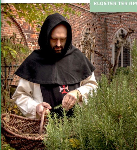
KLOSTER TER APEL

Inmitten der waldreichen Umgebung von Ter Apel liegt eine einzigartige kulturhistorische Perle: das ehemalige Kreuzherrenkloster Domus Novae Lucis aus 1465. Dieses einzige in den Niederlanden erhaltene mittelalterliche Kloster auf dem Land steht auf der UNESCO-Liste des Welterbes. Heute befindet sich in dem Kloster ein Museum mit faszinierenden Ausstellungen. Im Klostergarten wachsen mehr als 200 unterschiedliche Pflanzenarten und im Klosterladen finden Sie außergewöhnliche Produkte. Auch ein Besuch im Bierkeller ist unbedingt die Mühe wert.