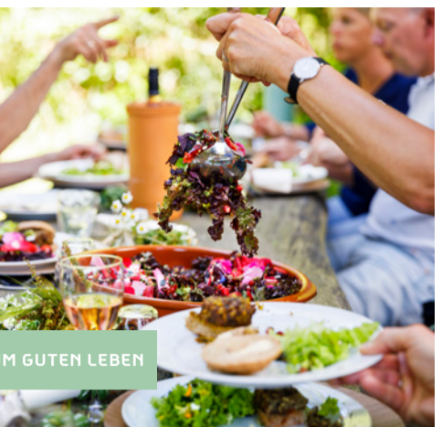
ZUM GUTEN LEBEN

Westerwolde ist eine der elf Cittaslow-Gemeinden der Niederlande. Cittaslow ist das internationale Qualitätslabel für Gemeinden, die sich der Verbesserung der Lebensqualität widmen, indem sie das Authentische pflegen und damit den Sprung in die Zukunft schaffen. Tradition geht hier Hand in Hand mit Innovation. Es ist eine Anerkennung des lokalen und regionalen Charakters dieser Region, in der es sich angenehm wohnen, arbeiten und leben lässt. Kernelemente sind: Identität, Qualität, Tradition, Nahrungsmittel und Nachhaltigkeit.