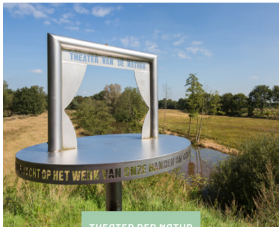
THEATER DER NATUR

Am Dennenweg in Sellingen finden Sie das kleinste Theater der Niederlande: das Theater der Natur. Dem bildenden Künstler Adriaan Nette kam die Idee auf einer Führung durch Westerwolde. Durch einen drehbaren Bühnenrahmen auf einem Stativ sieht man die umgebende Landschaft immer wieder aus anderer Perspektive und erlebt man jeden Tag eine andere Vorstellung. Auf den fünfzehn Treppenstufen zum Aussichtspunkt stehen fünfzehn Gedichte, unter anderem von Harry Muskee.