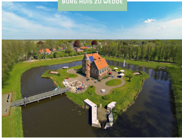
BURG HUIS ZU WEDDE

Malerische Bachläufe, überraschende Ausblicke, historische Gebäude und mittelalterliche Wälder: Die Kulturerbelandschaft Westerwolde lädt zu herrlichen Spaziergängen ein. Wählen Sie eine der 40 Wanderwegen über Distanzen von 1,5 bis 16 Kilometer. Es gibt auch spezielle Wanderwegen mit Schnitzeljagd für Kinder. Jedes Jahr am 4. Wochenende im Juni findet das Westerwolde Wanderwochenende statt, an dem man hier ein oder zwei Tage wandern kann.