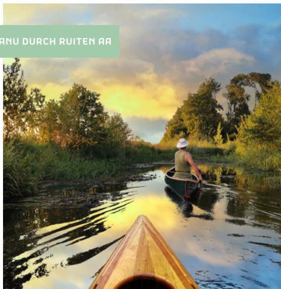
KANU DURCH RUITEN AA

Eine gute Möglichkeit, Westerwolde zu entdecken, ist vom Wasser aus. Über verschiedene Flüsse, Kanäle und Bäche geht es vorbei an lauschigen Dörfern und hübschen Sehenswürdigkeiten. Sie können beispielsweise mit Ihrem eigenen Boot nach Bourtange fahren, um dort an einer Veranstaltung teilzunehmen oder eine ausgedehnte Rundfahrt zu unternehmen. Für Angler ist Westerwolde der ideale Ort. Fischtreppen ermöglichen es den Fischen, von den Bächen und Flüssen der Aas ins Meer und wieder zurück zu schwimmen. Gut für die Fische und für die Fischer!