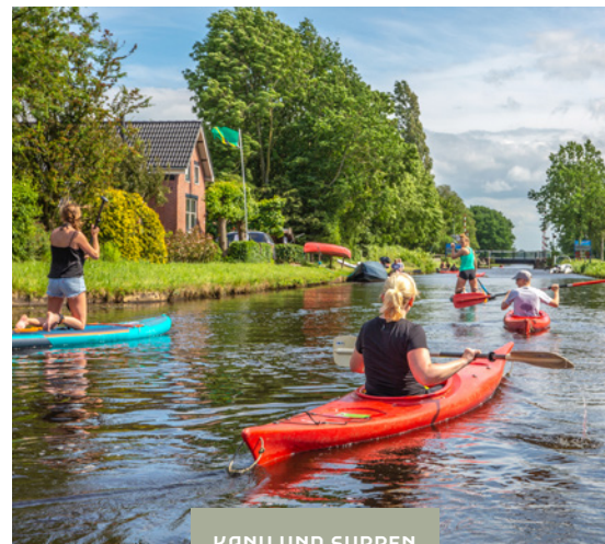
KANU UND SUPPEN

Vom Wasser aus kommt der Reichtum der Fehnkolonien noch besser zur Geltung. Legen Sie Ihr Boot im Zentrum von Veendam an oder an einer der Anlegestellen in Wildervank, Oude Pekela oder Nieuwe Pekela. An den Dutzenden kleinen Zugbrücken werden Sie von den freundlichen Brückenwächtern begrüßt. Auf routesingroningen.nl und tasmanroutes.nl finden Sie verschiedene Wasserrouten durch die Fehnkolonien. Außerdem können Sie die Region ausgiebig erkunden: Es gibt gute Verbindungen zwischen den Wasserwegen, z.B. zum Zuidlaardermeer und nach Deutschland.