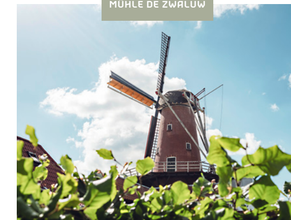
MÜHLE DE ZWALUW

Groningen ist eine echte Wanderprovinz. Auf routeningroningen.nl wählen Sie selbst eine Wanderroute mit der gewünschten Länge. Die Wanderrouten können selbstverständlich in beiden Richtungen von Knotenpunkt zu Knotenpunkt gelaufen werden. Aber auch eine der vielen Themenrouten voller Geschichten und Sehenswürdigkeiten ist für eine Wanderung sehr empfehlenswert. Wie beispielsweise die Pilgerwegen in den Fehnkolonien. Die Provinz Groningen hat ganze einhundertdreißig mittelalterliche Kirchen: hier kommen Sie so richtig zur Ruhe.